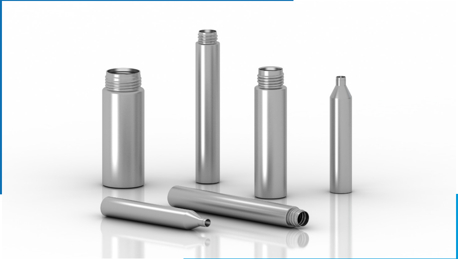
Examples Application Pens Beispiele Applikationsstifte

— Further options: You don't want to put ink on paper, but want to apply active ingredients to the skin? We also offer solutions for this with our Medicpen. Talk to us about it!